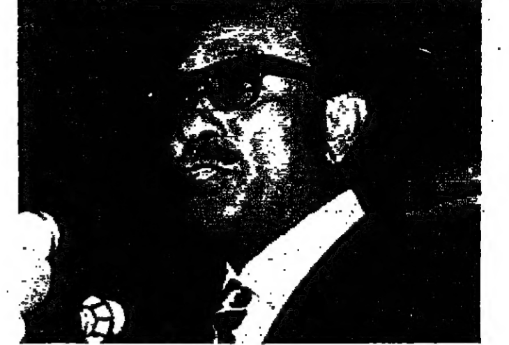
الرئيس السادات يلقي خطابه مساء امس

ارجا الرئيس انور السادات اعلان قراره بشأن النداء الذي وجهه اليه مجلس الامن الدولي لتبديد مهمة قوات الطوارئ بسيناء ، واعلن في خطابه مساء امس انه سيستجيب بمجلس الامن القومي لاتخاذ القرار . ولم يتطرق الرئيس المصري بصراحة مباشرة الى مقترحات اتفاق فك الارتباط في سيناء . وقال الرئيس السادات في الخطاب الذي استغرق ساعتين والذي القاه في الجلسة الافتتاحية للوزير القومي لمجلس الامن القومي المصري تطورات الموقف في ضوء نداء مجلس الامن الدولي بشأن مهمة قوات الطوارئ الدولية في سيناء التي تنهي يوم غد الخميس . والسادات الرئيس السادات التمسيع المنجز القومي للاتحاد الاشتراكي العربي بما يستقر عليه الرأي في هذا الشأن . واوضح ان مصر ستقوم بدراسة الموقف من جميع جوانبه ، مع الاخذ في الاعتبار ان مسؤولية مجلس الامن الدولي لا تقع عند حد تخفيف مهمة القوات ، وانما تتناول في سيناء التطبيق الكامل لقرار رقم ٢٣٨ لسنة ١٩٧٢ ، والقرارات الاخرى المتعلقة بالمسألة . وقال ان قوات الطوارئ تستمد شرعية وجودها من رضى الدولة المصرية ، وعلى ذلك فليس مقبول على الاطلاق ان يفتى قوات